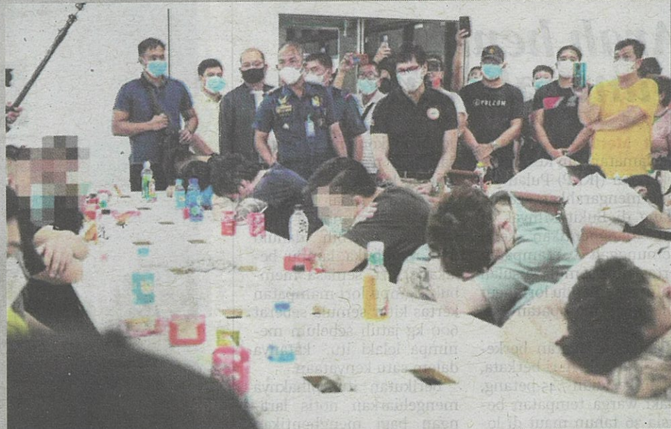
PIHAK berkuasa Filipina menyelamatkan 2,000 pekerja termasuk warga asing yang menjadi mangsa aktiviti penyeludupan manusia di Filipina.

Menurut laporan media CNN Filipina, lebih 2,000 pekerja, termasuk warga asing, diselamatkan daripada aktiviti penyeludupan manusia, Selasa lalu, selepas pihak berkuasa melakukan serbuan di hab POGOs di Las Piñas City.